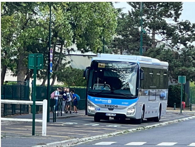
Allée des Peupliers (près du square)

Cette mesure décidée par le Maire, approuvée par la Direction du collège, a été prise dans un souci de sécurité et de fluidifier la circulation dans ce secteur de Parmain.