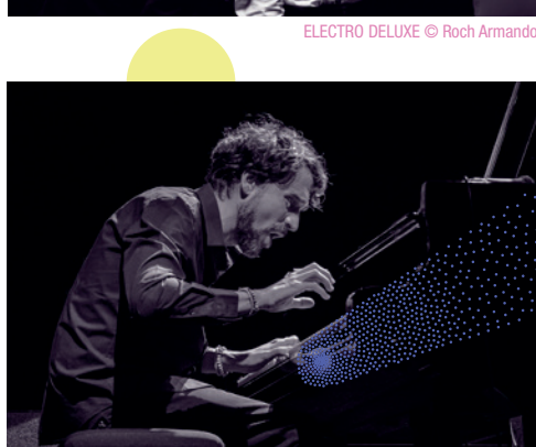
ELECTRO DELUXE