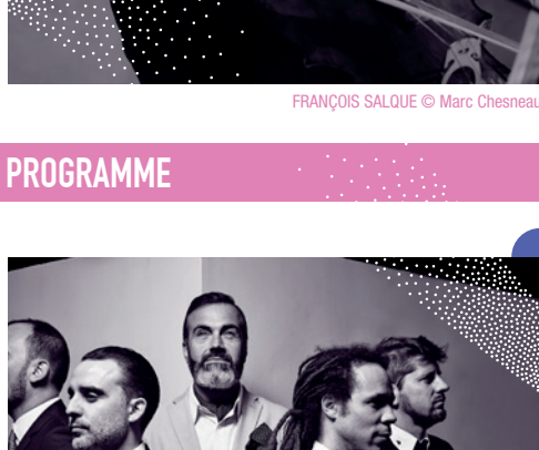
FRANÇOIS SALQUE © Marc Chesneau