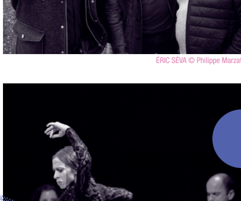
ÉRIC SÉVA

Engagée par Jazz au fil de l'Oise, avec le soutien de la DRAC IDF et du Conseil départemental du Val d'Oise, la résidence de VINCENT PEIRANI s'exercera de diverses manières sur le terrain et sur nos scènes, concerts, actions pédagogiques, interventions... Elle s'inscrit dans notre projet de favoriser le développement des pratiques tout autant que d'éveiller à cette musique ou susciter l'engagement de nouveaux publics.