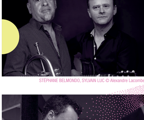
STÉPHANE BELMONDO, SYLVAIN LUC

SAMUEL STROUK, guitare, ADRIEN MOIGNARD, guitare, FRANÇOIS SALQUE, violoncelle, JÉRÉMIE ARRANGER, contrebasse