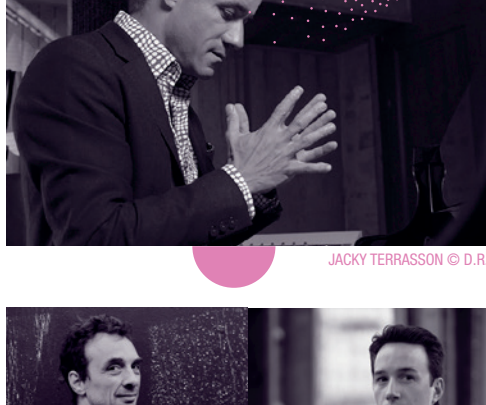
JACKY TERRASSON

STÉPHANE BELMONDO, trompette, bugle, SYLVAIN LUC, guitare Sortie d'album à l'automne 2019